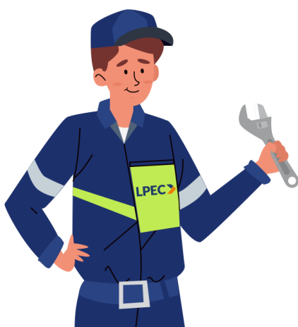
Strój roboczy pracowników LPEC S.A.

Zespół Lubelskiego Przedsiębiorstwa Energetyki Ciepłej S.A.